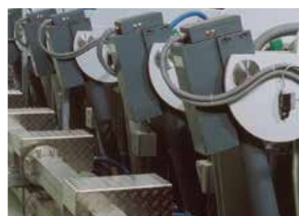
Cámaras de laminado/recubrimiento