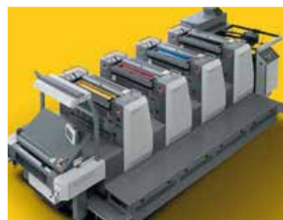
Maquinaria de impresión