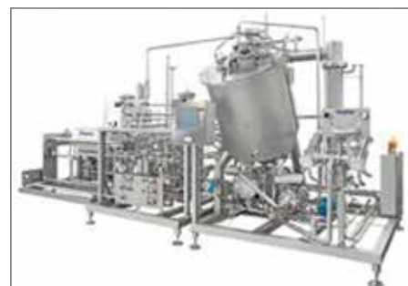
Maquinaria para la alimentación