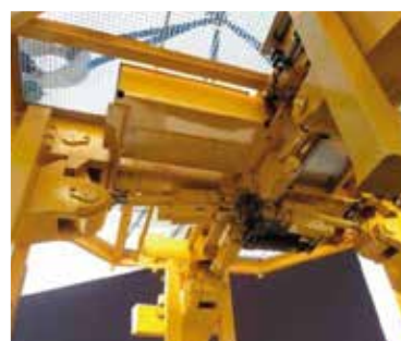
Barcos y otras aplicaciones navales