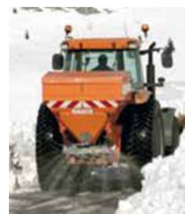
Esparcidoras de sal