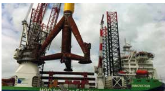
Aplicaciones en plataformas offshore