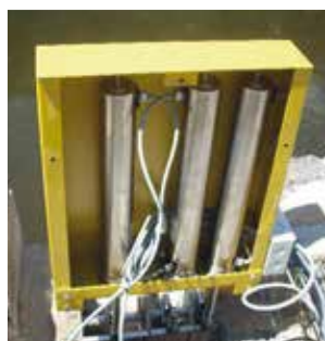
Ajuste de compuertas