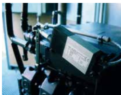
Sistemas de cogeneración